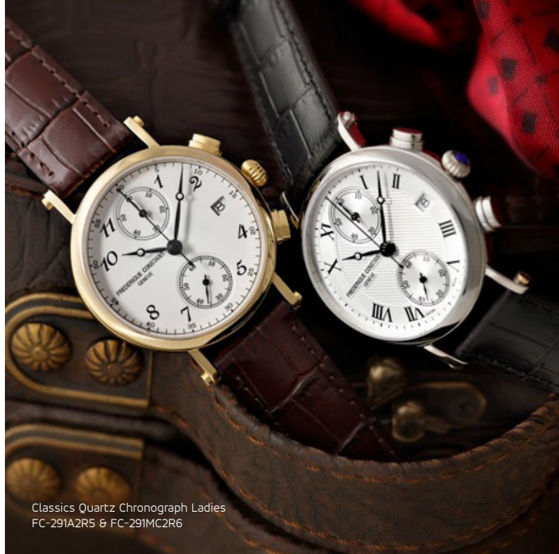
Classics Quartz Chronograph Ladies FC-291A2R5 & FC-291MC2R6