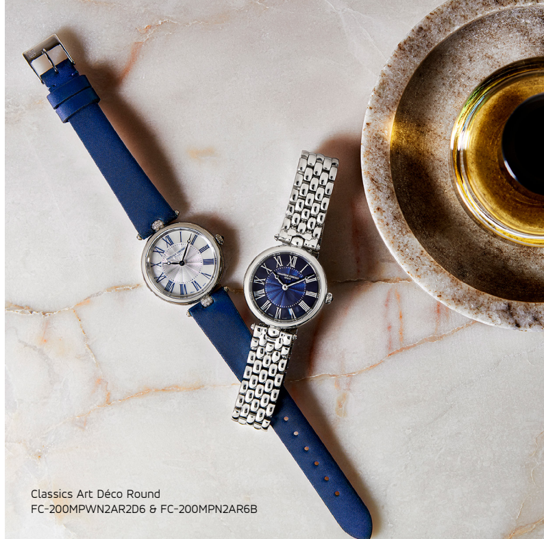
Classics Art Déco Round FC-200MPWN2AR2D6 & FC-200MPN2AR6B