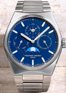
Highlife Perpetual Calendar Manufacture FC-775N4NH6B