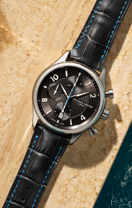
Runabout Chronograph Automatic FC-392RMG5B6