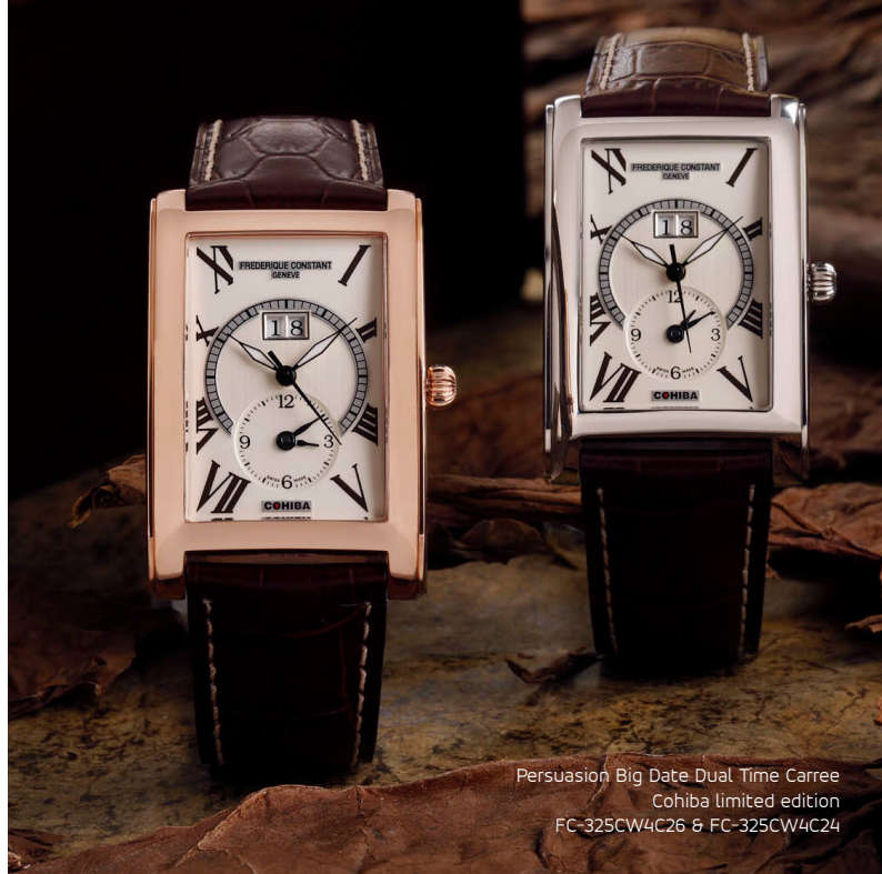
Persuasion Big Date Dual Time Carree Cohiba limited edition FC-325CW4C26 & FC-325CW4C24